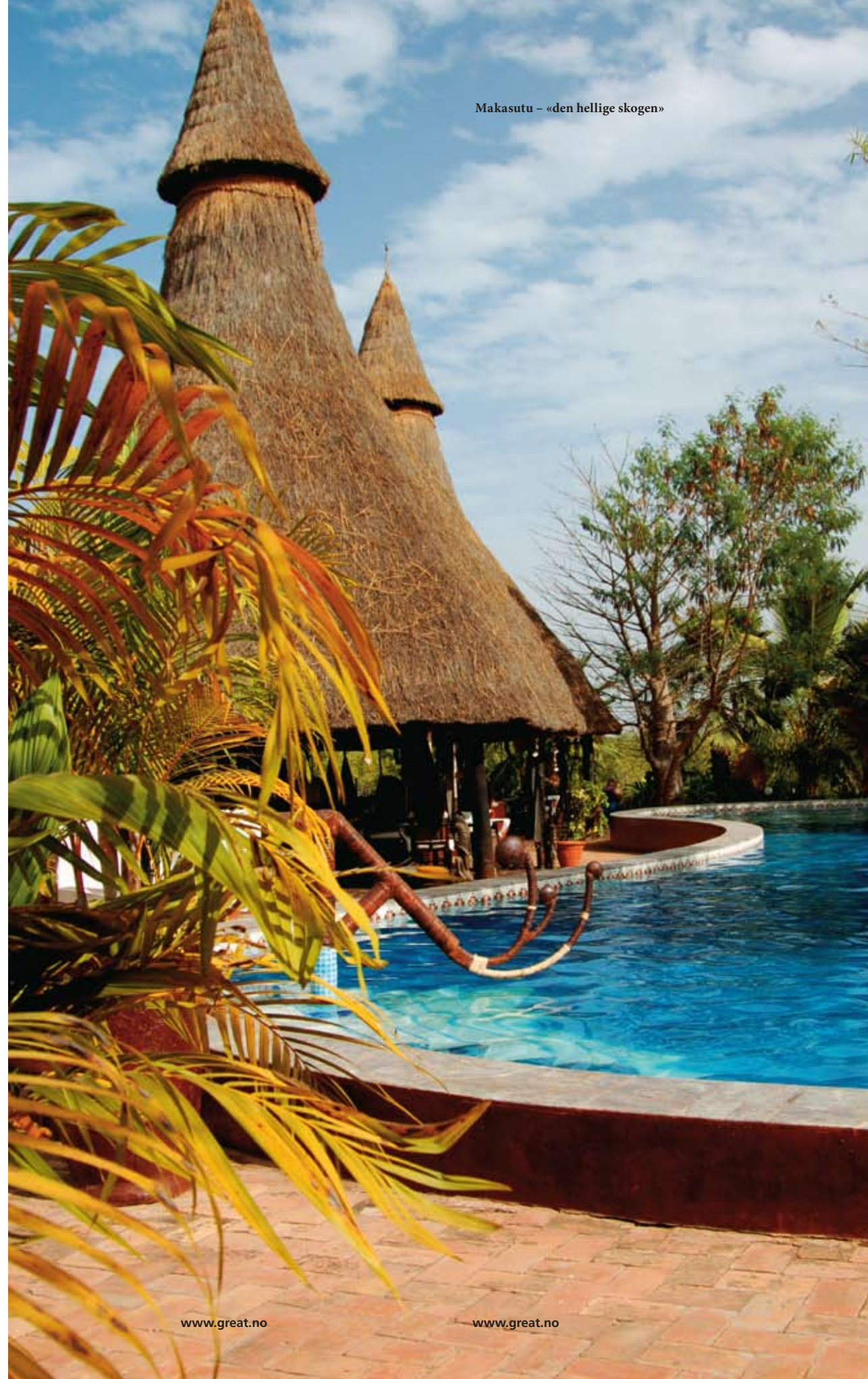
Makasutu – «den hellige skogen»

Jeg våkner til lyden fra moskeen. Det afrikanske lyset er ikke kommet på ennå og det er tid for morgenbønn i landsbyen ved Brefet Camp. Jeg ligger